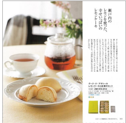
(グルメ) 「グーテ・アナトル」 レモンケーキと紅茶のセット