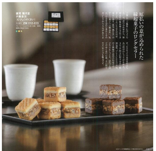
(グルメ) 「広尾 瓢月堂」 六瓢息災(むびょうそくさい)