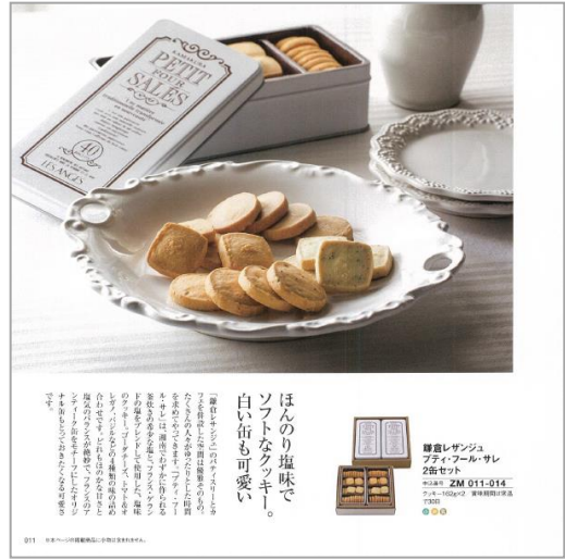
(グルメ)「鎌倉レザンジュ」プチ・フル・サレ2缶セット