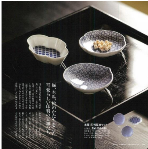
(モノ) 「東屋」 印判豆皿セット