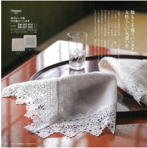
(モノ)「木村硝子店」ペアタンブラー