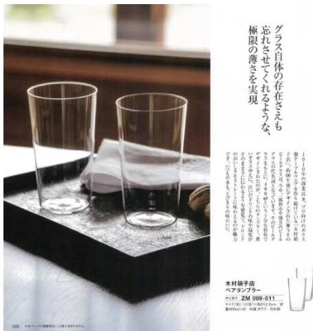
(モノ) 「近沢リース見せ」 ひざ掛けハンカチ