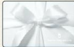
(UNITED ARROWS LTD GIFT CARD)