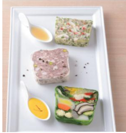
〈レザンファン ギャナ テリーヌ〉 〈原了郭 薬味セット〉