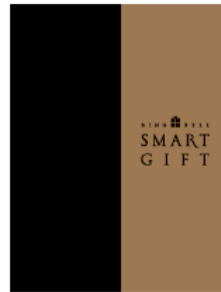
〈スマートギフトカタログ〉