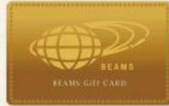
(ビームス ギフトカード)