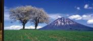
[巻頭特集] ニセコリゾート