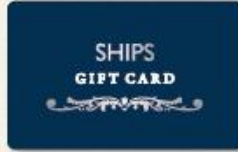
(シッパス ギフトカード)