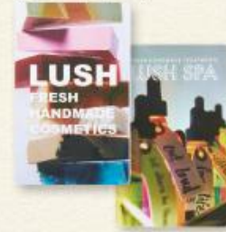
(ラッシュ ギフトカード)