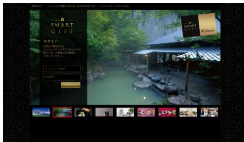
〈スマートギフト商品交換サイト〉約1万点のラインナップ