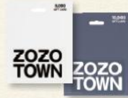
(ゾゾタウン ギフトカード)