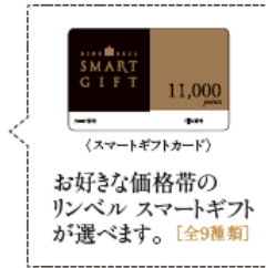
◀ 厳選した商品約680点を掲載 260×197mm / 308ページ