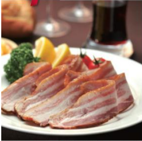
〈製菓工房 ハントヴェルク ウィンナー・ベーコンセット〉