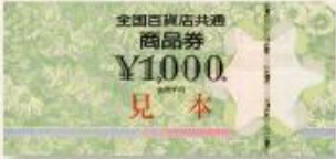
(全国百貨店共通商品券)