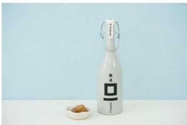
おくります1号 〈小布施製〉 ¥4,300

石川県輪島市で、10年以上蓄かされた良質の素材を使い、さまざまな木工品をつくる輪島キリトのあすなる弁当箱。輪島の地元材であるあすなるのいい香りと手触りのよさを。