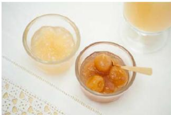
山形県産アソート詰合せ 〈セゾンファクトリー〉 ¥3,150

木曾五木といわれる、あすなる、さわら、ひのき、ねずこ、こうやまきの5種類の木の表情を、そのままいかしたシンプルな銅敷き。テーブルを彩るインテリアとしても。