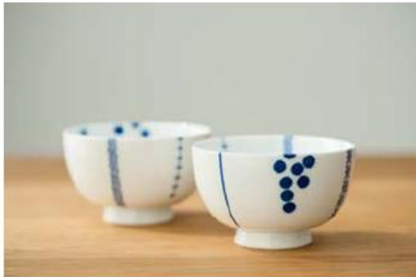
ペア花茶碗 ハナカザリ 〈東原〉 ¥4,000

銀板転写による印刷の技法で絵付けしたお茶碗。ひとつひとつ手作業で絵付けしているため、微妙なズレやかすれもまた味。柄はアーティスト立花文憲さんによるデザインです。