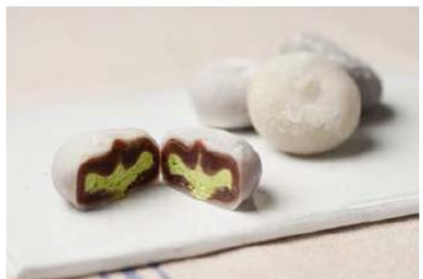
喜久福4種詰合せ 〈喜久水庵〉 ¥2,000

衆の郷、長野県小布施町にある小布施製菓の栗栗ノ子と、お隣の唯一市村漁港の純米酒のギフトセット。栗と餅で「おくります」というネーミングもシャレがきいています。