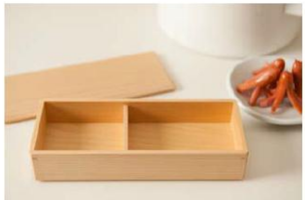
あすなる弁当箱 〈輪島キリト〉 ¥9,450

山形の代表的な果物、さくらんぼとラ・フランスのおいしさをそのままジャムにし、ラ・フランスジュースとセットに。濃厚で滑らかな舌触りのジュースは贅沢な味わいです。