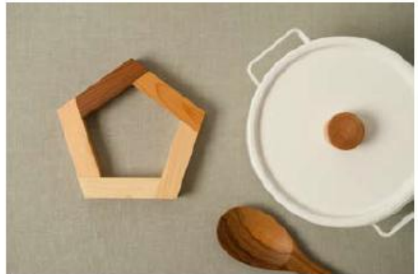
五木 銅敷き 〈asahinoko〉 ¥3,150

銀板転写による印刷の技法で絵付けしたお茶碗。ひとつひとつ手作業で絵付けしているため、微妙なズレやかすれもまた味。柄はアーティスト立花文憲さんによるデザインです。