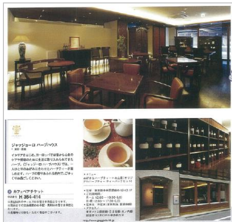
ジャズジョーロハーブハウス カフェペアチケット