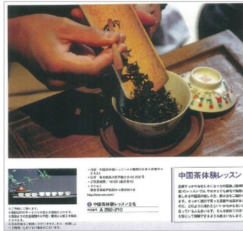
茶禅草堂「茶菓子付中国茶レッスン(2名)