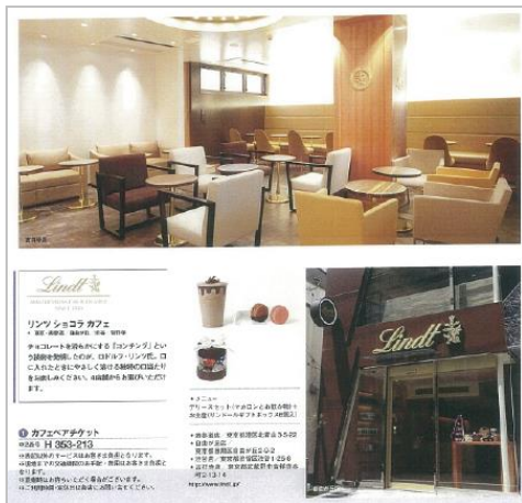
リンツショコラカフェ ペアチケット